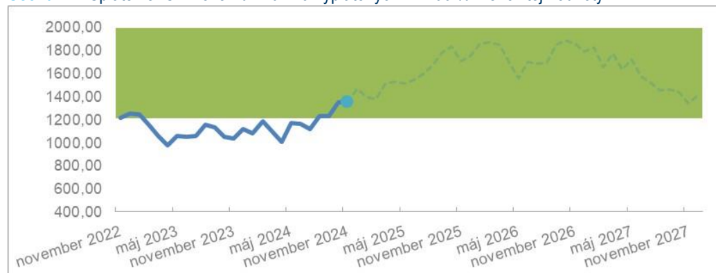
Scenár 1: Splatenie IC v novembri 2024 a vyplatených 114,00 % Menovitej hodnoty