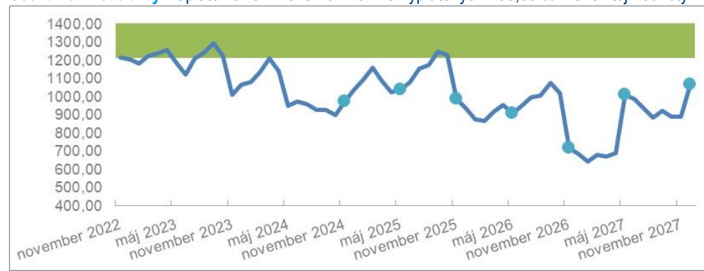
Scenár 3 - neutrálny: Splatenie IC v novembri 2027 a vyplatených 100,00 % Menovitej hodnoty