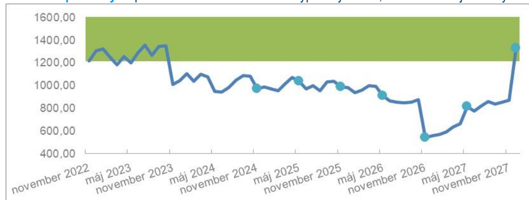
Scenár 2 - pozitívny: Splatenie IC v novembri 2027 a vyplatených 135,00 % Menovitej hodnoty