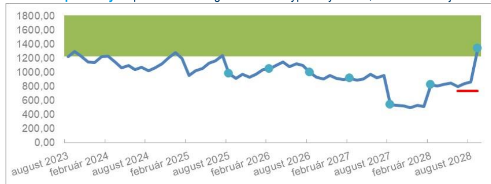
Scenár 2 - pozitívny: Splatenie IC v auguste 2028 a vyplatených 140,00 % Menovitej hodnoty