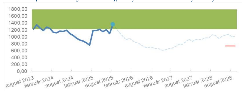
Scenár 1: Splatenie IC v auguste 2025 a vyplatených 116,00 % Menovitej hodnoty