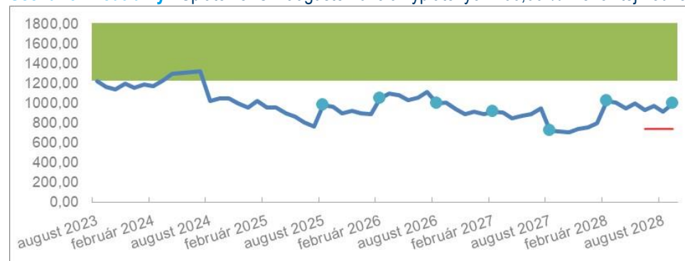
Scenár 3 - neutrálny: Splatenie IC v auguste 2028 a vyplatených 100,00 % Menovitej hodnoty